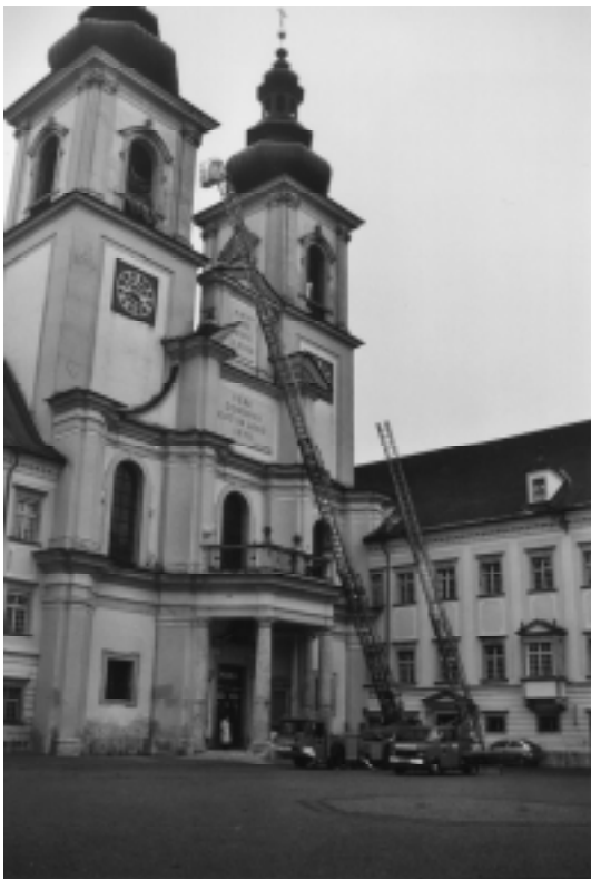
Die neue Feuerwehr-Drehleiter reicht sogar bis an die Stifts-Glockentürme

Am neuen Gerät, dem schwersten und teuersten der Feuerwehr Markt, werden acht Feuerwehrleute ausgebildet. Technisch ist die generalisanierte Drehleiter so ausgestattet, dass bei 12 Meter Entfernung zum Gebäude noch der 7. Stock, das sind 23 Meter Höhe, erreicht werden müssen. Das ist beispielsweise die Höhe