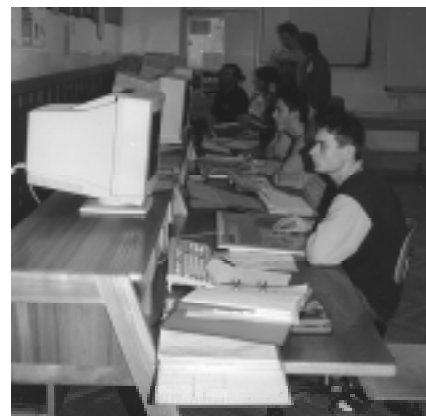
Die Arbeit am Computer wird in der Berufsschule immer wichtiger

Die Schüler waren mit Begeisterung an der Arbeit und stellten bei den Führungen und im Unterricht ihr Wissen und Können unter Beweis. Auf Stellwänden informierten sie auch über die Inhalte der einzelnen Unterrichtsgegenstände. Der große Besucherstrom wurde am Ende der Führungen im Internat mit einem kleinen Imbiss belohnt.