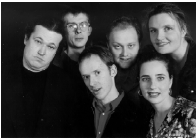
„Die lange Nacht des jungen Kabarett“ findet am Samstag, 6. März bereits zum 2. Mal im Kulturzentrum Kino statt