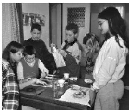
Ein Vorgeschmack: Volksschüler bei der praktischen Arbeit in der Hauptschule