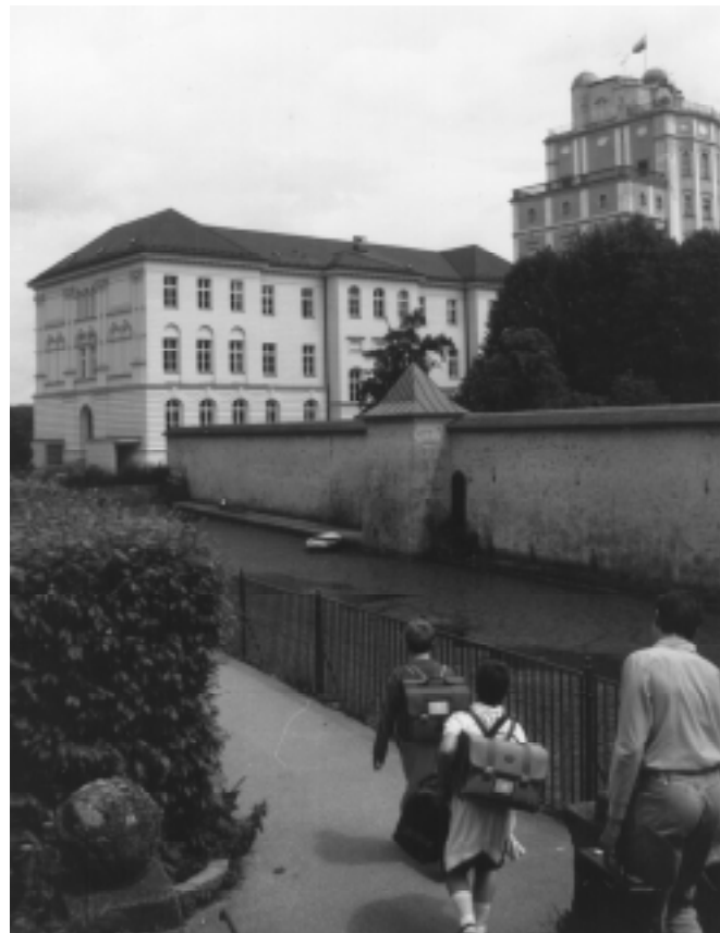
Auf dem Weg ins Stiftsgymnasium

Am 21. Mai 1999 wird ein ganzer Tag in Form einer Akademie den Zielsetzungen und Beweggründen für eine Klosterschule im 21. Jahrhundert gewidmet sein. Dabei wird auch das Ergebnis einer professionellen Wertestudie der Schüler und Absolventen unseres Gymnasiums präsentiert.